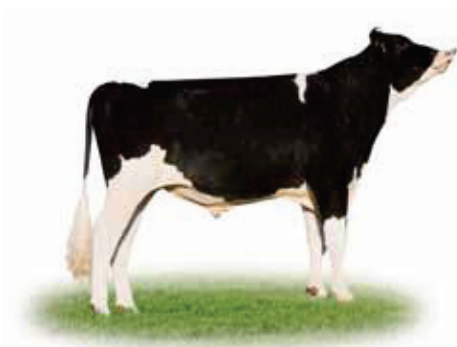
VH Gorm (B Goldwyn) - Holstein GenVikPLUS-tyr