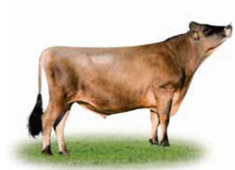
VJ Buster (DJ Beo) - Jersey GenVikPLUS-tyr