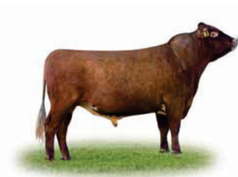
VR Lime (K Lens) - VikingRed GenVikPLUS-tyr